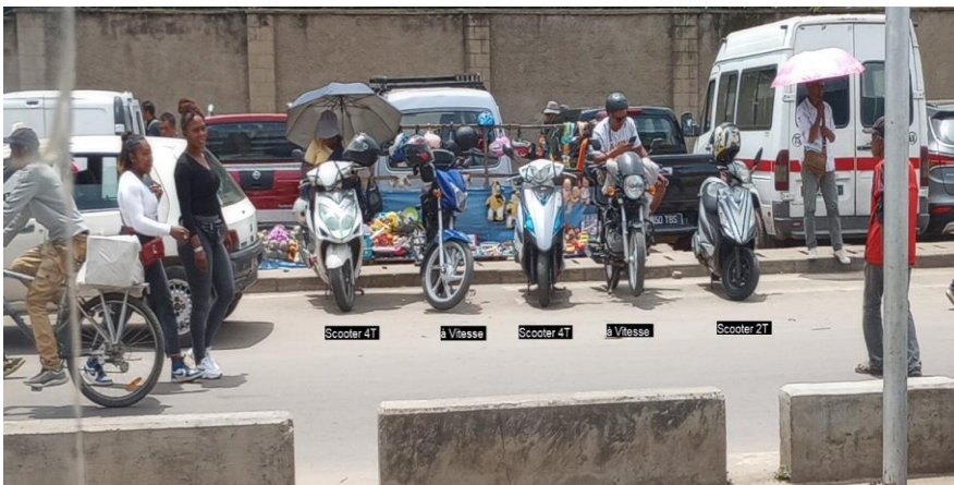
Les trois types de motos utilisées : scooters 4 temps (majorité), scooters 2 temps et motos à vitesse.