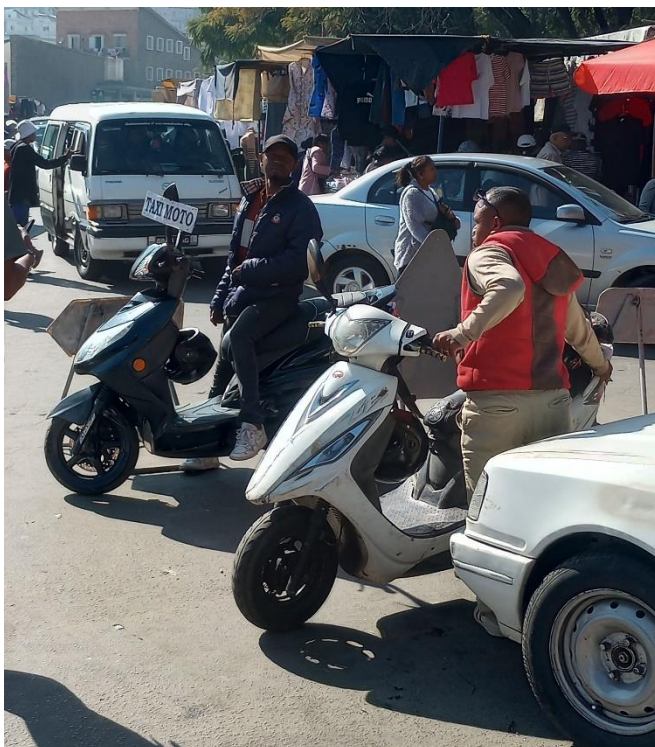
Les Taxi-moto au cœur de la ville d'Antananarivo