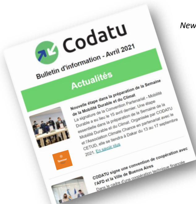
Newsletter représentant 5000 abonnés