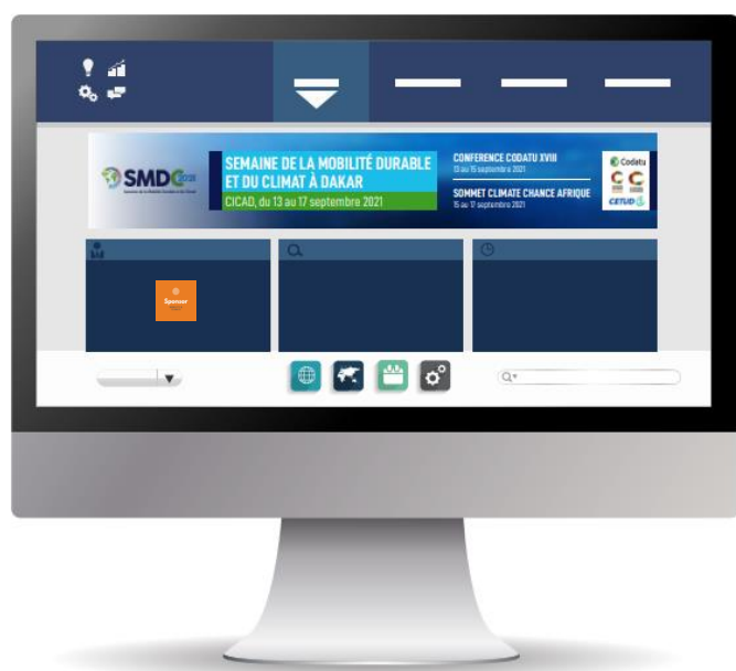
Site web dédié et plateforme digitale