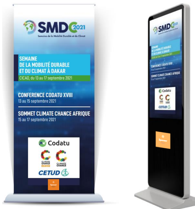
Totems digitaux d'information et de signalétique dans le CICAD